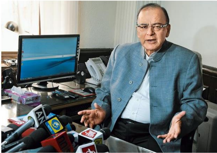
Jaitley will address the APIC-India Capital Markets and Institutional Investors Summit here on Monday in his first visit to the global financial centre—Hong Kong—as India's finance minister.

Arun Jaitley seeks foreign investments for infrastructure, other sectors.