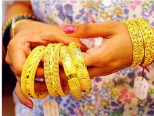
Gold jewellery imports under the India-Asean FTA face 2% import duty against 10% through the normal trade channel, offering an attractive arbitrage opportunity.

Gold jewellery imports from ASEAN get tougher as government asks for bank guarantee.